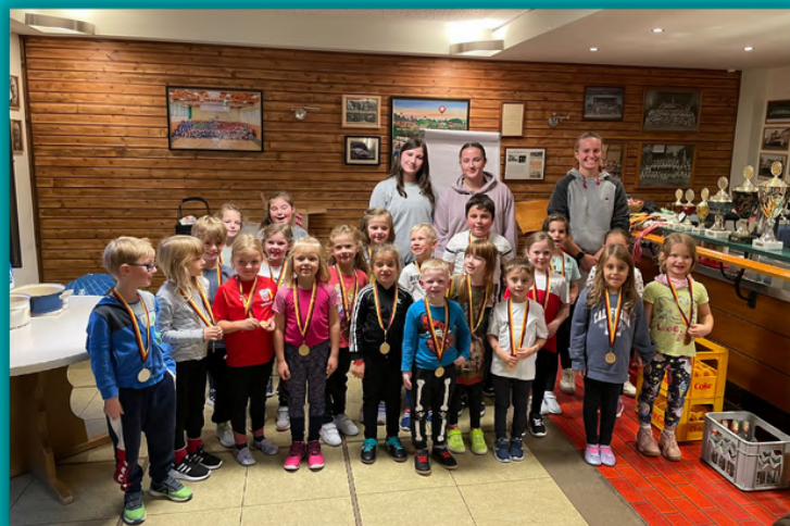
Alle U8 Kinder