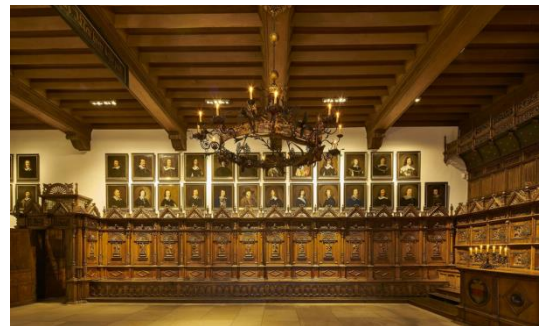
Rathaus Münster, Westfälischer Frieden

Die endgültige Route wird erst nach der Vortour im Frühsommer bekannt gegeben. Willst du dabei sein? Du kannst gern mitkommen und uns begleiten.